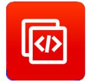
增强型 AT 命令集